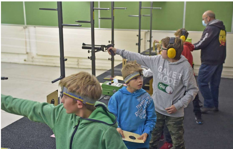
Der jüngste Pistolennachwuchs in der Schiessanlage im Badener Esp im Wettkampfeinsatz.